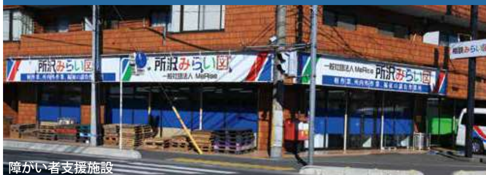
障がい者支援施設