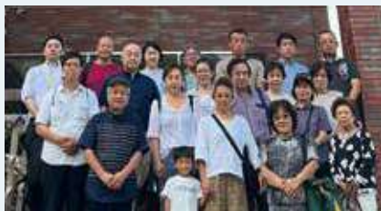
シャトー勝沼ワイン工場にて

また、今回の視察研修会はコロナ禍が明けて4年ぶりの開催となり、久しぶりにお顔を拝見する会員の方もいらっしゃり、非常に有意義なものとなりました。