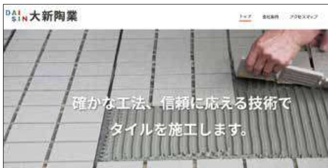
補助金を活用して作成したHP

※DX推進員へのデジタル化のご相談は随時受け付けておりますのでお気軽にご連絡ください。