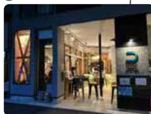
tacos&tapas トンポバル (14)