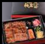
焼肉弁当 1,700円 (税込 1,836円)より ※要予約

焼肉韓菜 和っ黒 (ワッコク) TEL:04-2968-8929 (予約) 所沢市東町 12-37 船橋ビル2F 【営業時間】ランチタイム AM11:30 ~ PM15:00 (L.O.14:30) 【定休日】 ディナータイム PM17:00 ~ PM23:30 (L.O.22:45) お問合せ下さい とこなび https://tokorozawa-navi.com/shop/wakkoku Twitter @wakkoku8929 Facebook https://www.facebook.com/wakkoku_和っ黒_102453641916904/