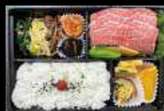
(黒毛和牛上カルビ弁当) 要予約

焼肉韓業 和っ黒 (ワッコク) TEL:04-2968-8929 (予約) 所沢市東町 12-37 船橋ビル 2F 【営業時間】ランチタイム AM11:30 ~ PM15:00 (L.O.14:30) 【定休日】 ディナータイム PM17:00 ~ PM23:30 (L.O.22:45) お問合せください とこなび https://tokorozawa-navi.com/shop/wakkoku Twitter @wakkoku8929 Facebook https://www.facebook.com/焼肉韓業_和っ黒_102453641916904/