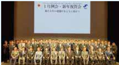
新年の幕開けを祝う参加者一同

2年ぶりに開催した新年祝賀会は、ご来賓の方々や青年部歴代会長、OB会員、現役メンバーと交流を深めることが出来、良い1年のスタートを切ることができました。