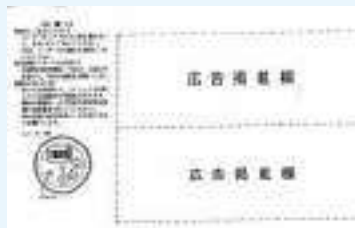
検針票のサンプル