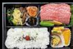
(黒毛和牛上カルビ弁当) 要予約

《プロが選ぶ王道の味》安心・安全・健康 オーナーシェフ自ら選んだ銘柄黒毛和牛・地産産の新鮮な野菜・生産者直送のお米(魚沼産)・数々の名酒等など、又焼肉のタレからキムチすべてを手作りし素材の良さを生かした本物の味を日々探求しております。