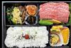
(黒毛和牛上カルビ弁当) 要予約

焼肉韓菜 和っ黒 (ワッコク) TEL:04-2968-8929 (予約) 所沢市東町 12-37 船橋ビル 2F 【営業時間】ランチタイム AM11:30 ~ PM15:00 (L.O.14:30) 【定休日】 ディナータイム PM17:00 ~ PM23:30 (L.O.22:45) お問合せください とこなび https://tokorozawa-navi.com/shop/wakkoku Twitter @wakkoku8929 Facebook https://www.facebook.com/焼肉韓菜_和っ黒_102453641916904/