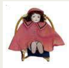
青い目の人形 (三ヶ島小学校所蔵)

1941年(昭和16年)太平洋戦争が始まると、アメリカから贈られた「青い目の人形」の大部分が処分され、現在は約300体しか確認されていません。また、アメリカに贈られた「答礼人形」は、43体がアメリカ各地で保存されているのが確認されています。埼玉県内には、178体の「青い目の人形」が配られ、現在12体しか保存が確認されていません。所沢地域では、市立三ヶ島小学校に唯一保存されています。