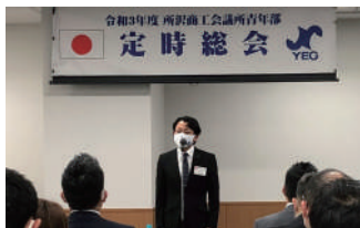
挨拶をする紅葉会長

定時総会では、紅葉会長が議長となり、令和2年度の事業報告および収支決算について審議し、承認されました。