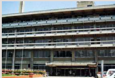
昭和62年4月 旧市庁舎3階に移転(所沢市宮本町)