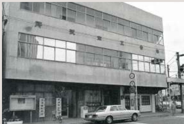
昭和34年10月 所沢商工会館が落成(所沢市元町)

大正3年4月、所沢商工会が組織されるが、戦時中、商工会は解散を命ぜられ商業報国会に名称を変更しました。また、終戦後の昭和21年、商工会を復活し地域経済の発展と、地域社会の福祉増進の役割を果たしました。この間、所沢町も隣接村の合併により行政規模も拡大され、昭和25年11月に市制が施行されるに及び、市内工商業者有志の間に商工会議所設立が要望され、昭和26年6月14日、社団法人所沢商工会議所を組織しました。