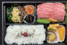
（黒毛和牛上カルビ弁当）要予約

とこなび https://tokorozawa-navi.com/shop/wakkoku Twitter @wakkoku8929 Facebook https://www.facebook.com/焼肉韓菜_和っ黒_102453641916904/