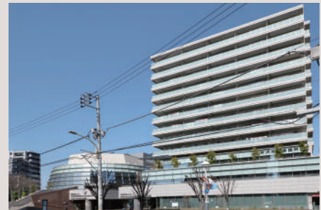
平成22年5月 新商工会館完成・事務所移転(所沢市元町)