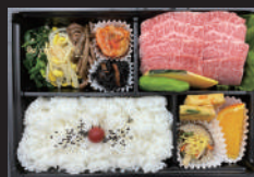
（黒毛和牛上カルビ弁当）要予約

《プロが選ぶ王道の味》安心・安全・健康 オーナーシェフ自ら選んだ銘柄黒毛和牛・地場産の新鮮な野菜・生産者直送のお米（魚沼産）・数々の名酒など、又焼肉のタレからキムチすべてを手作りし素材の良さを生かした本物の味を日々探求しております。