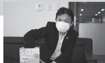
抽選の様子 (白石委員)